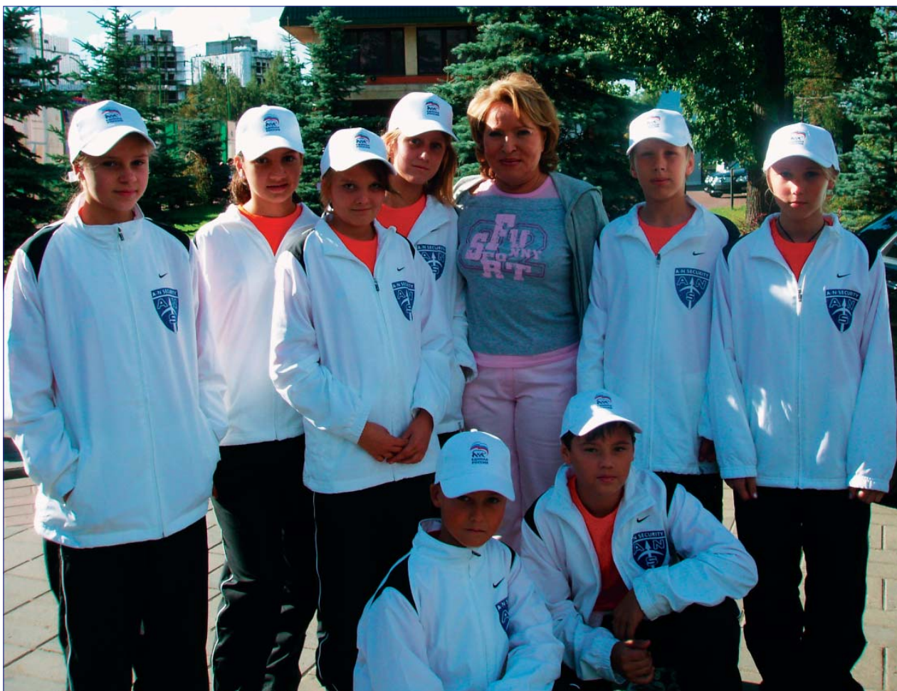
На фото: губернатор Санкт-Петербурга В.И. Матвиенко в окружении детей A-N Security. Подробности на стр. 4